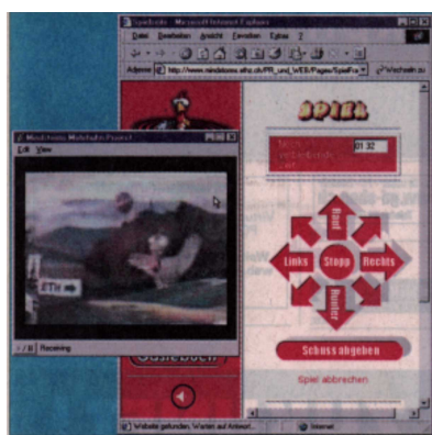
Jagd auf das Moorhuhn: Der «Mindstorms»-Roboter an der ETH Zürich (oben) und die Website des Projekts (links).

huhn, übers Web von irgendwoher auf der Welt möglich, ist für die Beteiligten eine durchaus ernsthafte Angelegenheit. Entwickelt, gebaut und getestet wurden Kanone, Steuerung und Web-Anbindung und Internetauftritt in den letzten zweieinhalb Monaten von einer Gruppe von zehn Elektrotechnik-Studenten im zweiten Semester; für die Moorhuhnjägerei erhalten sie Punkte gutgeschrieben, die für die Zulassung zu den Diplomprüfungen erforderlich sind.